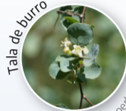
Tala de burro