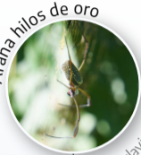
Araña hilos de oro