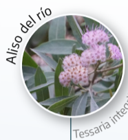
Aliso del río